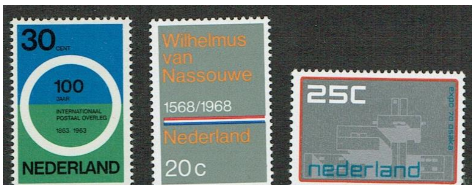
Figuur 8 Postzegelontwerpen door Crouwel NVPH 791; 908 964;

Naast werkzaam te zijn als grafisch ontwerper was hij ook actief in het educatieve en culturele circuit. Zo was hij al in de jaren vijftig werkzaam als docent bij de Koninklijke Academie voor Kunst en Vormgeving in 's-Hertogenbosch en het Instituut voor Kunstnijverheidsonderwijs in Amsterdam. Tussen 1965 en 1985 was hij verbonden aan de afdeling industrieel ontwerpen van de Technische Hogeschool Delft, als medewerker, docent, hoogleraar en bijzonder hoogleraar. Van 1987 tot 1993 gaf hij als bijzonder hoogleraar les bij Kunst- en Cultuurwetenschappen aan de Erasmus Universiteit Rotterdam. Daarnaast was hij van 1985 tot 1993 directeur van Museum Boijmans Van Beuningen in datzelfde Rotterdam. Een van de belangrijkste aspecten van Crouwels grafische werk is de typografie.