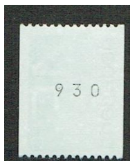
Figuur 12 NVPH 1110b Rolzegel met rugnummer