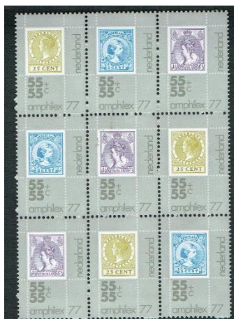
Figuur 11 Amphilex 1976 NVPH 1098-1100