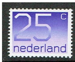
Figuur 10 NVPH 1110 type 1 voet cijfer 2 is 6% mm. Niet afgebeeld type 2 voet cijfer 2 7 mm.

Van een serie met een dergelijke lange looptijd en variaties in uitgifte vormen (vel- rol- zelfklevende- en postzegelboekjes zegels) valt er zeker een interessant verzamelgebied te maken! Om een voorbeeld te geven: Van de 25 cent zegels bestaan 2 typen, zowel bij de velzegel (1110) als bij de rolzegels. Bij de zelfklevende zegels komt alleen type2 voor (bron: NVPH speciale catalogus 2017)