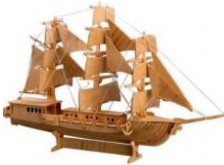
Figuur 1 zeilschip zelfbouwpakket