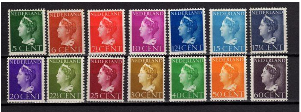
Figuur 2 Serie Wilhelmina type Konijnenburgh NVPH 332-345

Op 1 april 1940 kwamen de zegels (Figuur 2) in de verkoop. Precies 40 dagen voor de Duitse inval in Nederland op 10 mei.