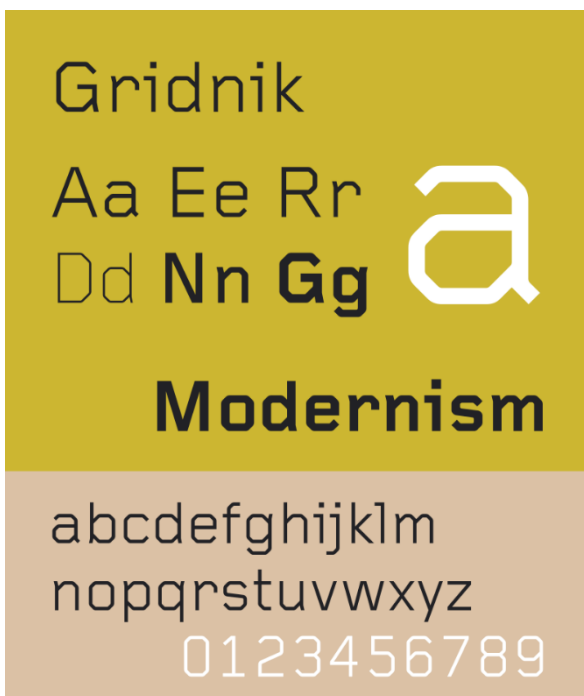
Figuur 7 Gridnik lettertype

Vanaf 1964 was Crouwel verantwoordelijk voor het ontwerp van de affiches, catalogi en tentoonstellingen van het Stedelijk Museum in Amsterdam.