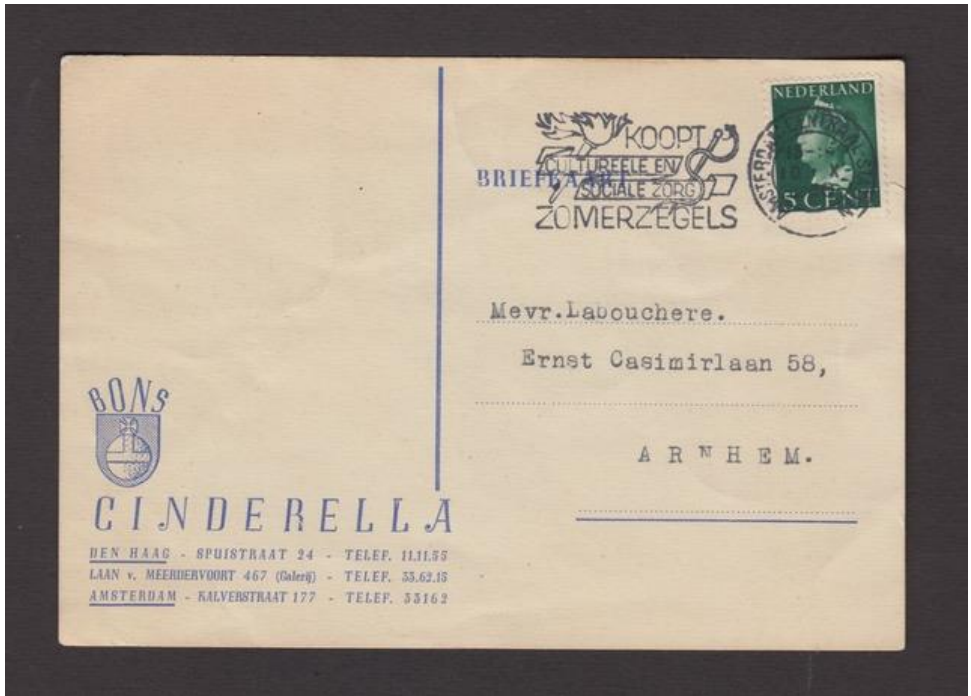
Figuur 3 NVPH 332 op briefkaart gedateerd 09-10-1940 van Amsterdam naar Arnhem

Een mooi voorbeeld is het volgende poststuk, zie hieronder. (figuur 3)