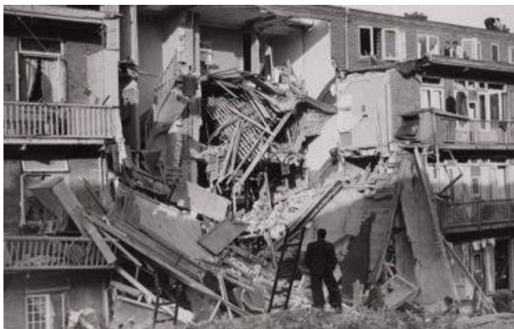
Figuur 5 Foto van de door het bombardement getroffen pand waar de reparatie afdeling van Cinderella gevestigd was

En zo bestaat mijn collectie "Konijnenburg" uit vele historische stukken die niet altijd filatelistisch van grote waarde zijn, maar historisch gezien wel heel bijzonder. Ze maken de collectie tot een echt oorlogsdocument.