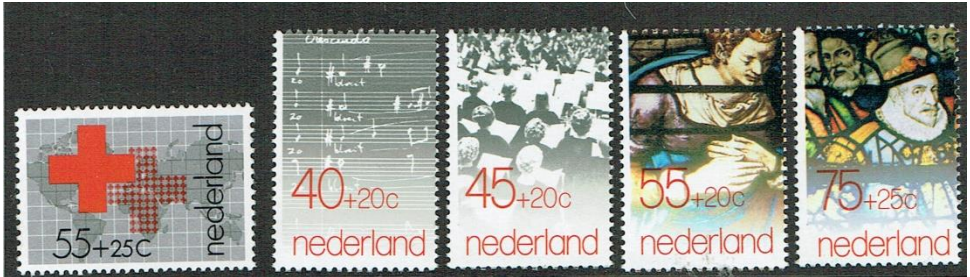
Figuur 9 Rode Kruis 1978 NVPH 1163 en serie zomerzegels 1979, NVPH 1175-1178 Muziekschrift; Kooruitvoering en Fragmenten van gebrandschilderd raam in de St. Jans Kerk in Gouda”

Serie zegels waaronder Zomerzegels 1978: